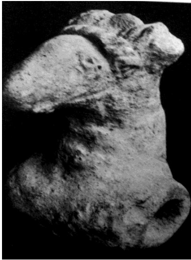
Fig.11. The Bankura Horse has become the Logo of Cottage Industry