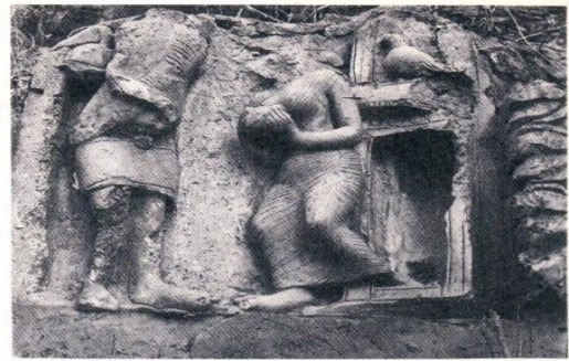
Fig.8. A bejewelled female divinity with five auspicious hairpins, 2nd century BCE in Bengal known as Yakshi