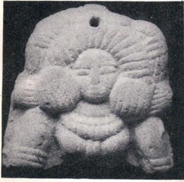
Fig. 5 & 6 A high relief figures similar to sanchi stupa no. 1, Sunga period