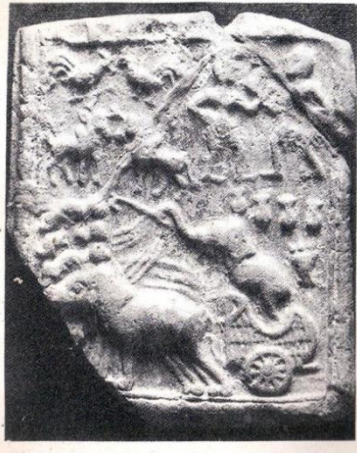
Fig.2. Plaque depicting the Circus Scene from Rajghat in Sunga period, 2 nd -1 st Cent.B.C.

हड़प्पा के उपरांत मृण्मय वस्तुयें अधिक संख्या में गंगा घाटी स्थलों से प्राप्त होती है जिसके प्रमुख केन्द्र मथुरा, अहीछत्र, कौशाम्बी, राजघाट, घोसी, पाटलीपुत्र, श्रावस्ती आदि हैं। सुंग काल की महत्वपूर्ण खोज मृण्मय फलक थे। ये फलक एकल सांचे से निर्मित किये जाते थे जिसके ऊपर लटकाने के लिए छिद्र बने होते थे। इन फलकों पर मुख्यतः नारी तथा धार्मिक आकृतियों को निर्मित किया जाता था। सुंग काल के सबसे सामान्य फलक "मिथुना" तथा "कामुक युगल" के हैं। मिथुना को कामुक युगल के जोड़े में चित्रित किया गया है जो कि शाश्वत प्रेम व प्रजनन क्षमता को प्रदर्शित करते हैं। इन फलक के किनारे बेल-बूटों से सुसज्जित किये गये हैं। कुछ मिथक दृश्यों पर भी आधारित फलकों को बनाया गया है जैसे Man holding a peacock, Scenes of spring festival, Picnic आदि जो अत्यंत महत्वपूर्ण हैं। यह कहना गलत होगा कि सुंग काल में केवल एकल सांचे से ही मूर्तियाँ व फलक निर्मित किये जाते थे जबकि इस काल